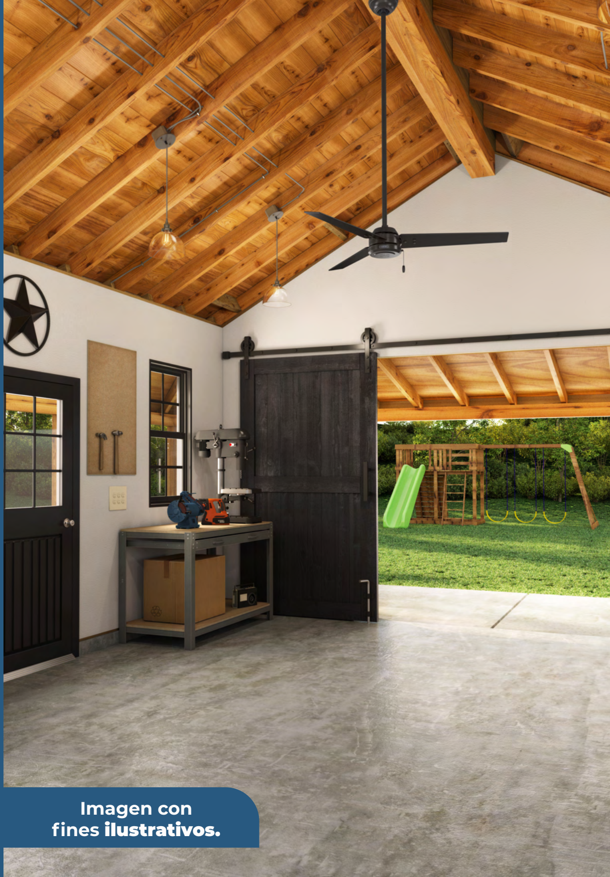
Imagen con fines ilustrativos.