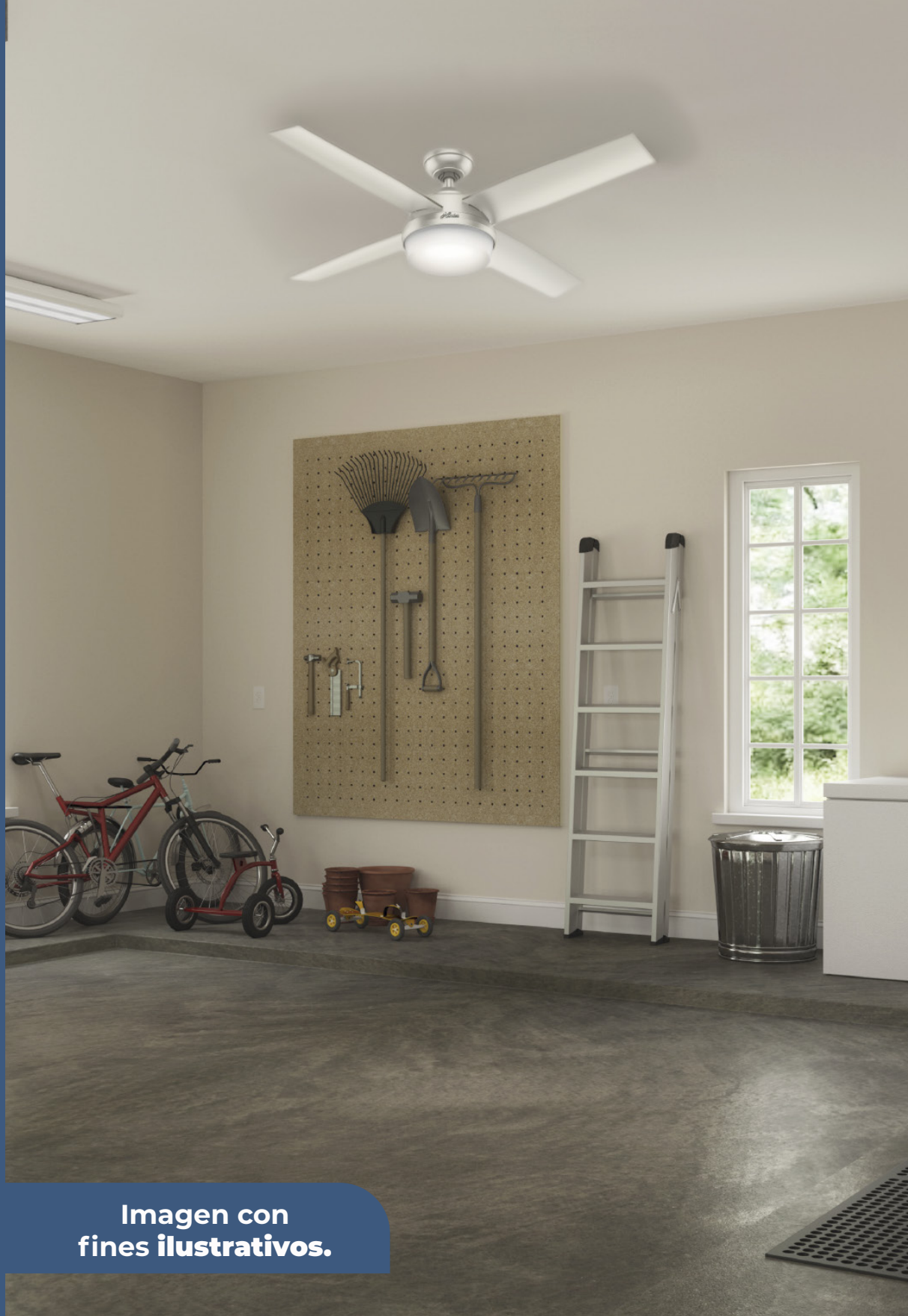
Imagen con fines ilustrativos.