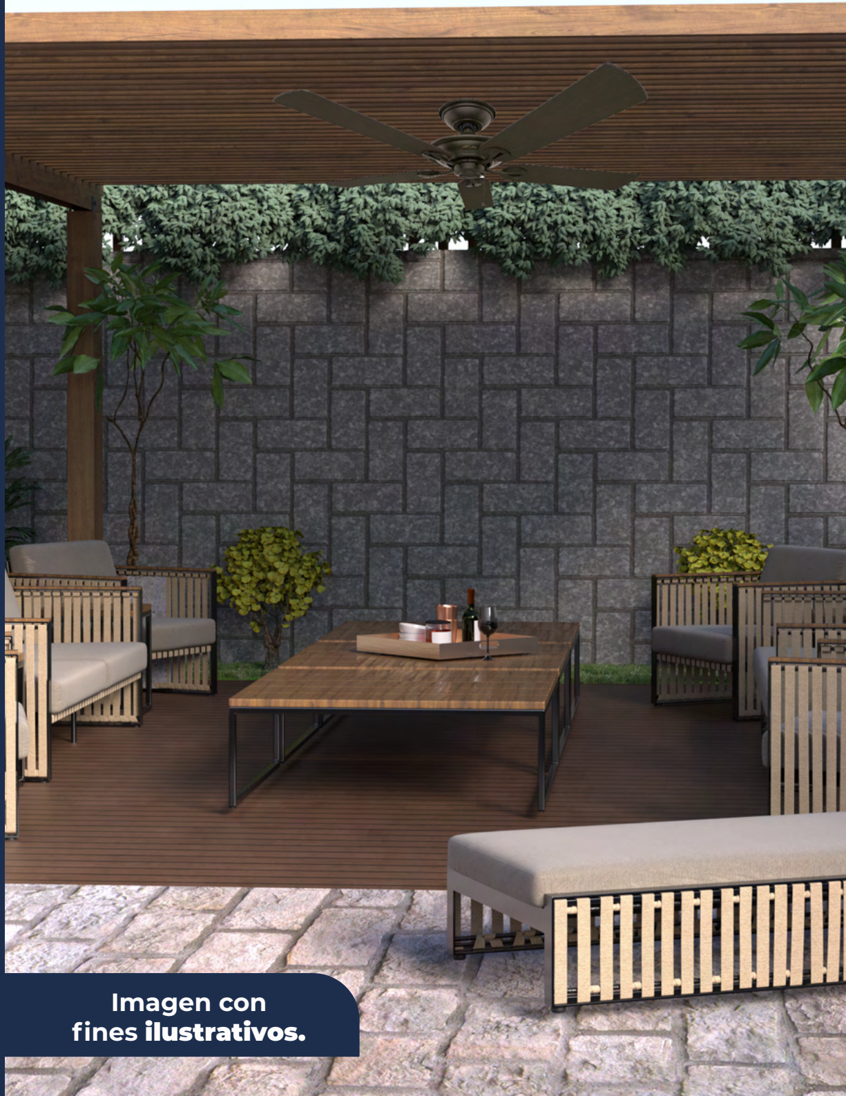
Imagen con fines ilustrativos.