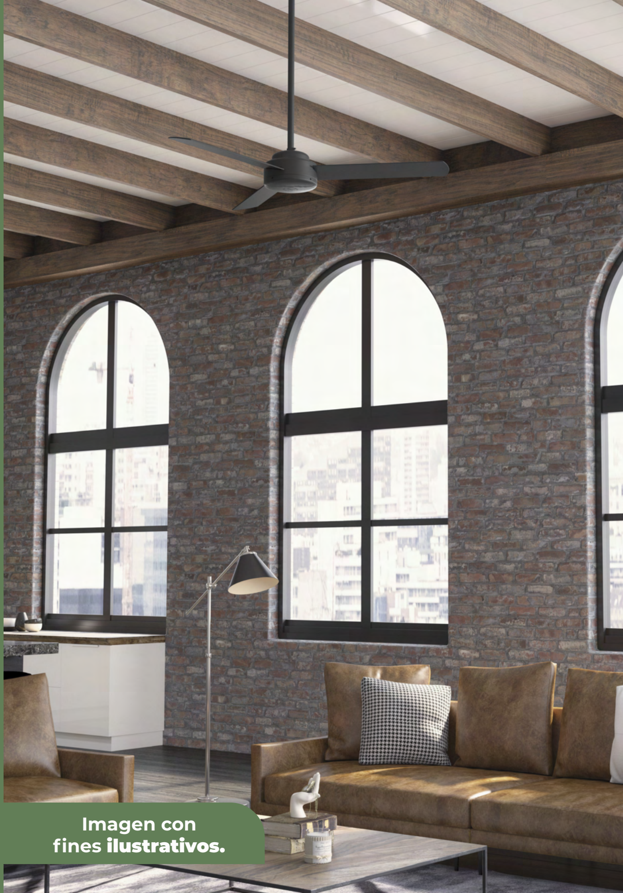
Imagen con fines ilustrativos.