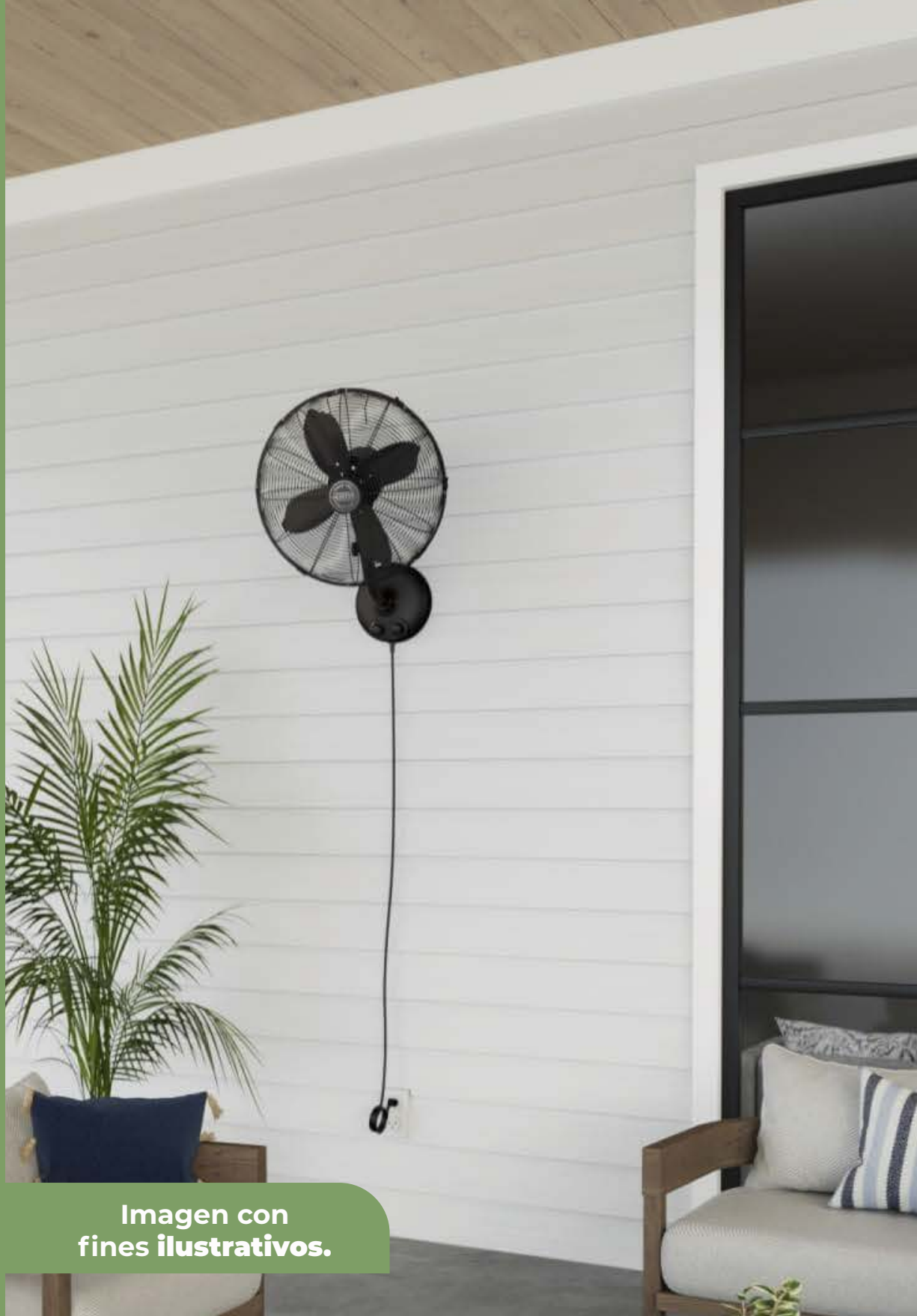
Imagen con fines ilustrativos.